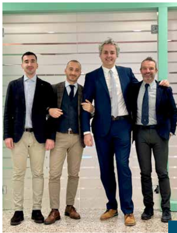
Gestori Private e Referente Assicurativo

Quello che ci contraddistingue dagli altri istituti Bancari è che mettiamo sempre la persona al centro. L'arma vincente è la vicinanza. La cosa difficile è farsi conoscere ma una volta che ci hanno conosciuto, i clienti capiscono che la nostra banca è differente. Vicinanza, competenza e solidità fanno della Banchina un unicum nel panorama degli