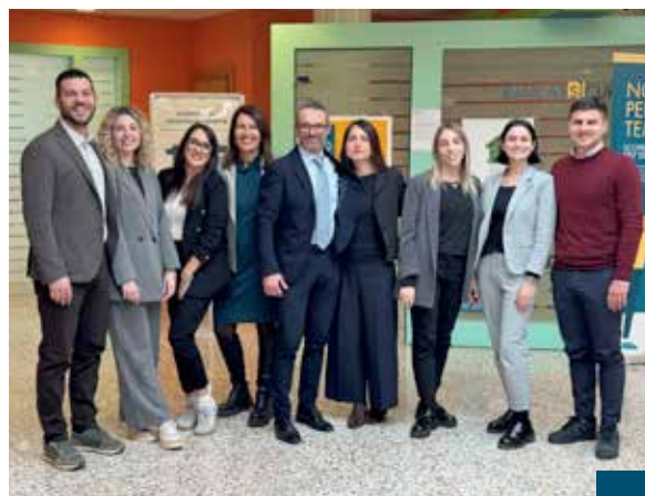
Filiale di Venturina

In conclusione - sottolinea Sacchini - i clienti oggi sono più competenti a partire dalla classe imprenditoriale - grazie anche al pas-