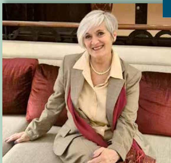
Presidente della CER

«Il cittadino può diventare produttore di energia installando, ad esempio, un impianto fotovoltaico. In una comunità energetica l'energia prodotta non viene solo autocon-