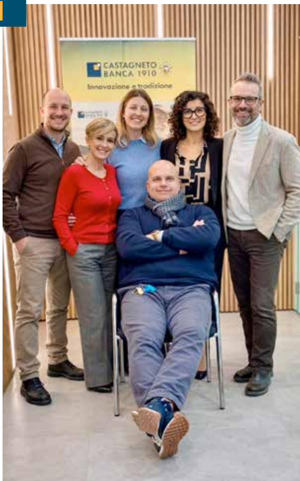
Filiale di Portoferraio

Istituti bancari. Sicuramente l'ingresso nel Gruppo Cassa Centrale avvenuto nel 2018 ha rafforzato l'aspetto della solidità.