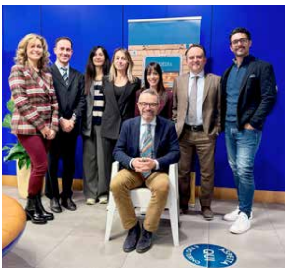
Filiale di Piombino