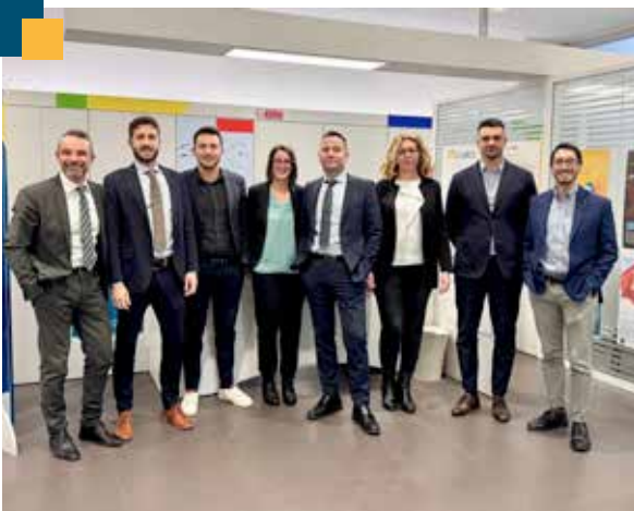
Filiale di Grosseto

Capo-area di Castagneto Banca, Sacchini guida filiali e team nel Centro e Sud della Toscana, valorizzando competenza, etica e relazioni nel credito cooperativo