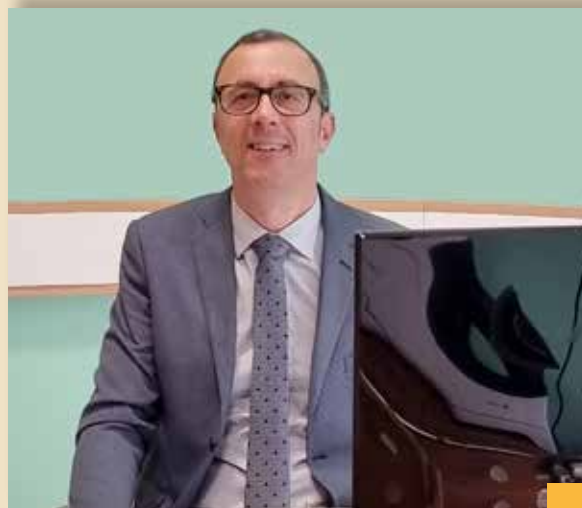
Responsabile Direzione Operations e HR Castagneto Banca

Quali benefici concreti può apportare la comunità energetica dell'area vasta della Provincia di Livorno?