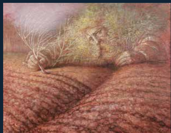
L'eterna scrittura , 2026 olio su tela, cm 70x90 firmato e datato "Giuggioli XXVI" in basso a destra sul retro titolo, misure e firma