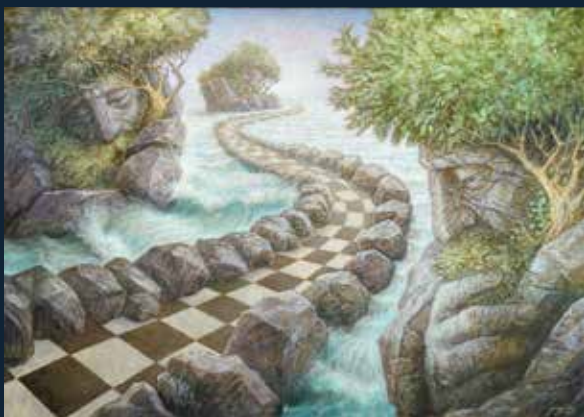
La giusta via , 2025 olio su tela, cm 70x100 firmato e datato "Giuggioli XXV" in basso a destra sul retro titolo, misure e firma

A Livorno ci attende quindi un percorso di scoperta dell'uomo e dell'artista (alla sua prima personale in città) capace di rappresentarsi in un piccolo autoritratto in contemplazione di un cielo stellato, in una sorta di novella estasi davanti alla vastità del creato, di cui anche l'artista può solamente intuirne la bellezza e il suo primo motore.