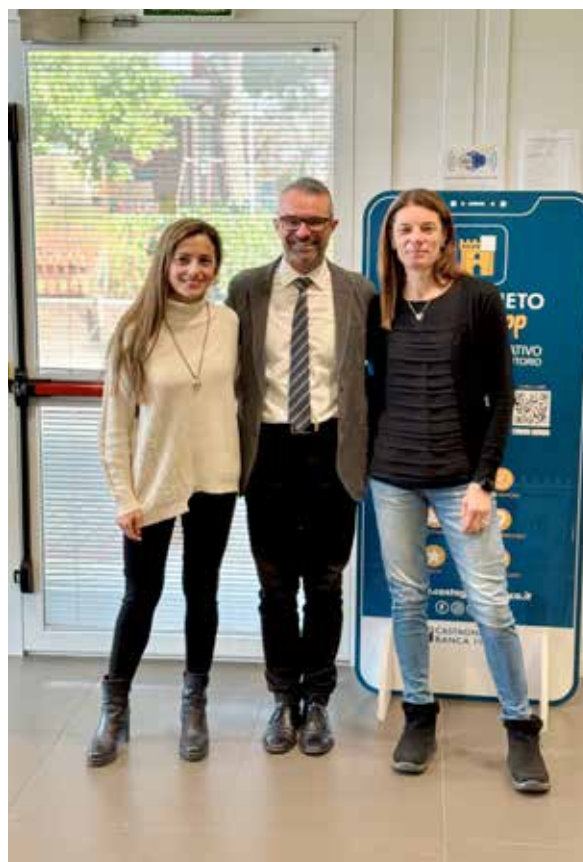
Filiale di Bagno di Gavorrano