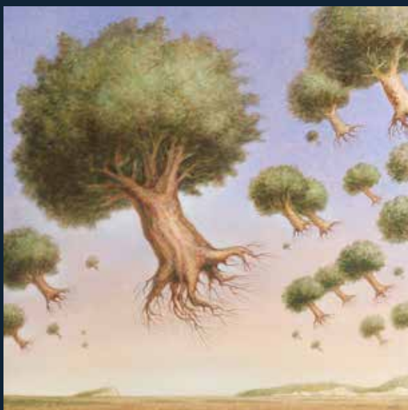
Migrazioni , 2025 olio su tela, cm 100x100 firmato e datato "Giuggioli XXV" in basso a destra sul retro titolo, misure e firma

Figlio di una terra affascinante per la storia che vi si è stratificata nei millenni e per i paesaggi in parte modellati dalla fatica umana, nel suo studio di Follonica il pittore viaggia attraverso la fantasia ripescando e svilup-